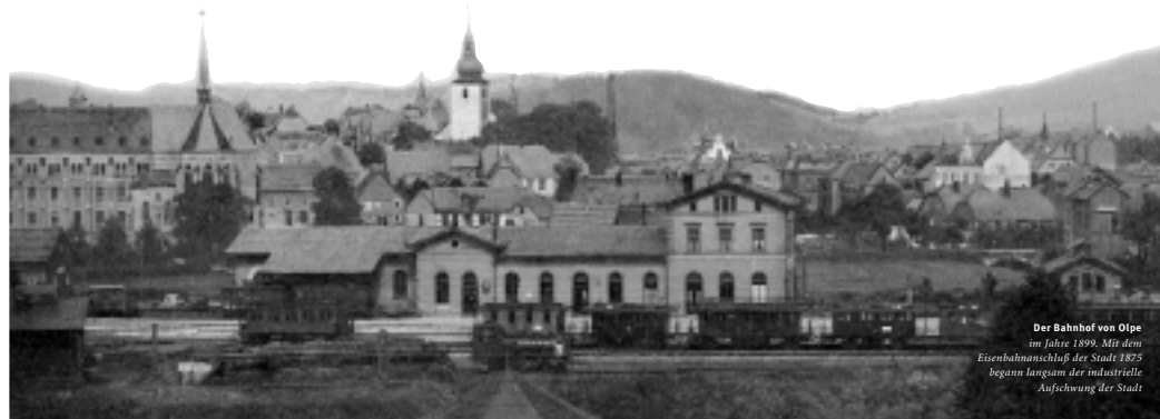
Der Bahnhof von Olpe im Jahre 1899. Mit dem Eisenbahnschluss der Stadt 1875 begann langsam der industrielle Aufschwung der Stadt

te, fiel der Westkreis weiter zurück. Die heimische Holzkohle war teuer und wenig effizient, der Abtransport der fertigen Produkte über die Landstraßen nicht konkurrenzfähig gegenüber der Bahn. Die Zahl der industriell Beschäftigten sank. Daher setzten die Olper Industriellen und die Kreisverwaltung alles daran, möglichst schnell auch eine westliche Strecke von Finnentrop durch das Biggetal über Attendorf, Olpe, Rothemühle, Freudenberg und Kirchen weiter nach Betzdorf zu bauen. Bereits 1863 begannen die Vorarbeiten, 1874 erreichte die Bahn Attendorf und 1875 Olpe. 1880 war der Anschluss nach Rothemühle fertig gestellt, aber erst 1907 kam man bis Freudenberg. Auch der Anschluss Olpes über Bergneustadt nach Köln ließ noch bis 1903 auf sich warten. Der ersehnte Aufschwung in Olpe kam daher langsam, aber doch unübersehbar: Waren 1875 erst 75 Menschen in Olpe in der Industrie beschäftigt, kletterte die Zahl binnen 20 Jahren auf 600.