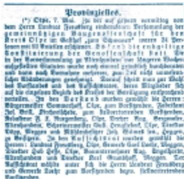
Olpe 1902: Meldung des Sauerländischen Volksblattes über die Gründung der Baugenossenschaft.

So vorbereitet trat dann am 6. Mai 1902 die »Constituierende Versammlung« der »Gemeinnützige Baugenossenschaft für den Kreis Olpe« eGmbH im Olper Hotel »Zum Schwanen« zusammen. 25 Interessenten