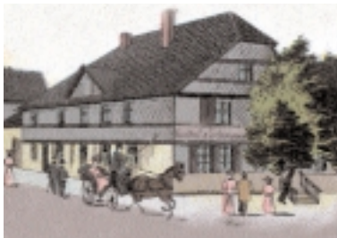
Im Gasthof zum Schwanen in Olpe wurde 1902 die Wohnungsgenossenschaft gegründet