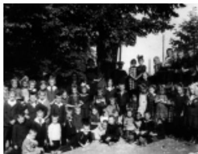
Schulklasse um 1900

Diese Entwicklung hatte aber auch ihre Kehrseite. Die Gemeinden mit Industriebetrieben konnten den vielen Arbeitern keinen ausreichenden Wohnraum zur Verfügung stellen. Selbst bauen konnte damals keiner, also nahmen viele Arbeiter entweder stundenlange Fußmärsche von ihren Heimatdörfern in die Fabrik in Kauf – so mussten sie wenigstens nicht auf ihren Garten, ihren Acker und ihre Kuh verzichten – oder sie mieteten sich