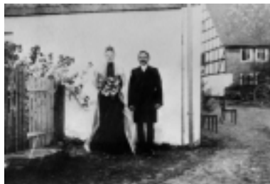
Brautpaar Grevenbrück um 1900. Viele Menschen im Kreis lebten damals in ärmlichsten Verhältnissen

Wohnung lag einige Stufen unter der Erdoberfläche, hatte nur wenige winzige Fenster und war feucht: »Die Frau, die mir entgegnetrat«, so berichtete Rinscheid, »zeigte keine Spur einer gesunden Gesichtsfarbe, vielmehr war das Gesicht mit starkem Ausschlag bedeckt. Ich rief: Wie können Sie in einer solchen Wohnung wohnen. Sie müssen ja krank werden. Die Frau antwortete: »Gewiß, ich weiß ja recht wohl, dass wir hier zu Grunde gehen, meine Schwester haben wir vor 14 Tagen beerdigt, dieselbe ist, wie der Arzt erklärte, infolge der schlechten, feuchten Wohnung krank geworden und gestorben und auch wir, meine Kinder und ich, gehen hier langsam, aber sicher zu Grunde. Eine andere Wohnung können wir nicht bekommen, da mein Mann nur wenig verdient und uns, da wir viele Kinder haben, niemand nehmen will.«