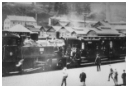
Der erste Zug von Olpe nach Freudenberg im Jahre 1907. Heute gibt es hier keine Gleise mehr.