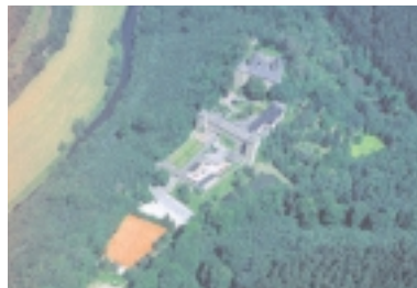
Die um 1220 gebaute Burg Schnellenberg in Attendorn gilt als die größte Burganlage Südwestfalens und ist der ehemalige Stammsitz der Freiherren von Fürstenberg

Die entscheidende Triebfeder der enormen Umwälzungen war der Eisenbahnbau. Er schloss den alten Kreis Olpe mit seinen verschlafenen alten Gewerbe- und Verwaltungsstädtchen Olpe und Attendorn, gelegen an den Knotenpunkten alter Handelsrouten, mit seinem weitgehend zersplitterten ländlichen Besitz, von dem kaum ein Bauer leben konnte, an die weitere Welt an, vor allem an das Ruhrgebiet und die Rheinschiene. Dem Eisenbahnbau folgten Fabriken, Walzwerke und Tagebau - Wohlstand für die