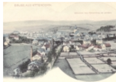
Stadtsicht Attendorn um 1910. Blick von Osten über die Fintnetroper Straße auf das Stadtzentrum.