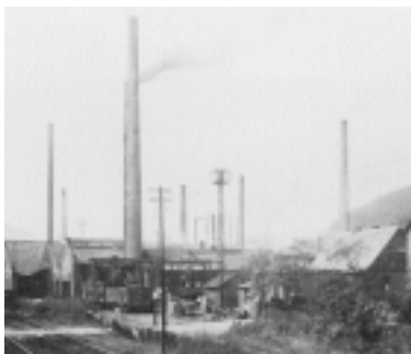
Die »Christinenhütte« in Maumke in den 20er-Jahren, neben Sachtleben eine der wichtigsten Industrieanlagen im Kreis.

Nach dem Genossenschaftsgesetz von 1889 mussten alle Genossenschaften einem Prüfungsverband angehören. Die Verbandsprüfer begutachteten nicht nur Rechnungslegung und Geschäftsführung, sondern auch die wirtschaftlichen Verhältnisse. So sollten die oft unerfahrenen Gremienmitglieder der Genossenschaften unterstützt, aber auch kontrolliert werden. Revisionsverband für die Baugenossenschaften war zunächst