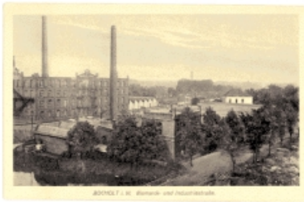
Ansicht der Industrianlagen an der Bocholter Industriestrasse