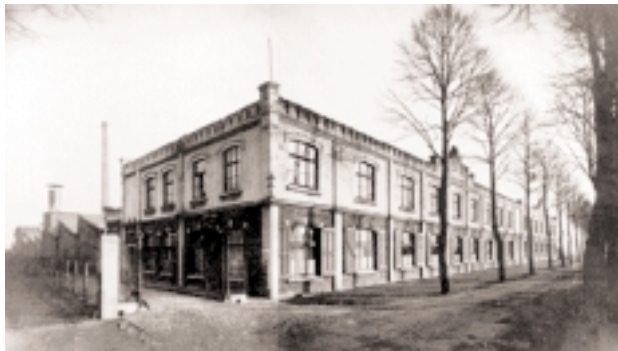
Die Weberei Cosman, Cohen & Co., 1938 kaufte H. Beckmann Söhne die bereits seit 1909 stillgelegte Fabrik

Firmenleitung wurde im Jahr 1933 notiert: »Der autoritären Staatsführung gelingt es in kurzer Zeit, die Krise wenigstens im Inland zu überwinden.« Dabei dachten die beiden Brüder wohl an die politische und wirtschaftliche Instabilität gegen Ende der Weimarer Republik. Politisch wie wirtschaftlich wollten die Nationalsozialisten die deutsche Wirtschaft so autark wie möglich machen. Die negativen Folgen konnte die Textilindustrie besonders zu Anfang, da sie weitgehend von Rohstoffimporten abhängig war. Nicht lange nach der Machtergreifung beschränkten