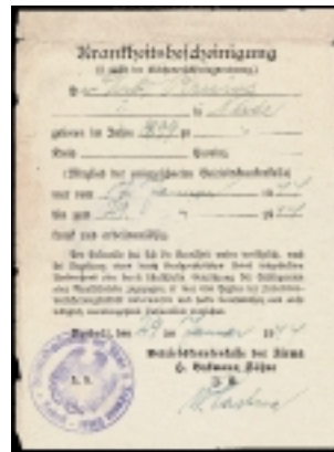
Krankheits- bescheinigung von 1944. Nur wenige Dokumente aus der Geschichte von H. Beckmann Söhne sind erhalten