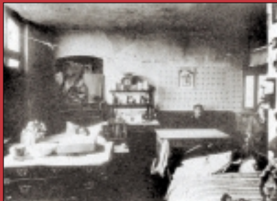
Arbeiterwohnung um 1900