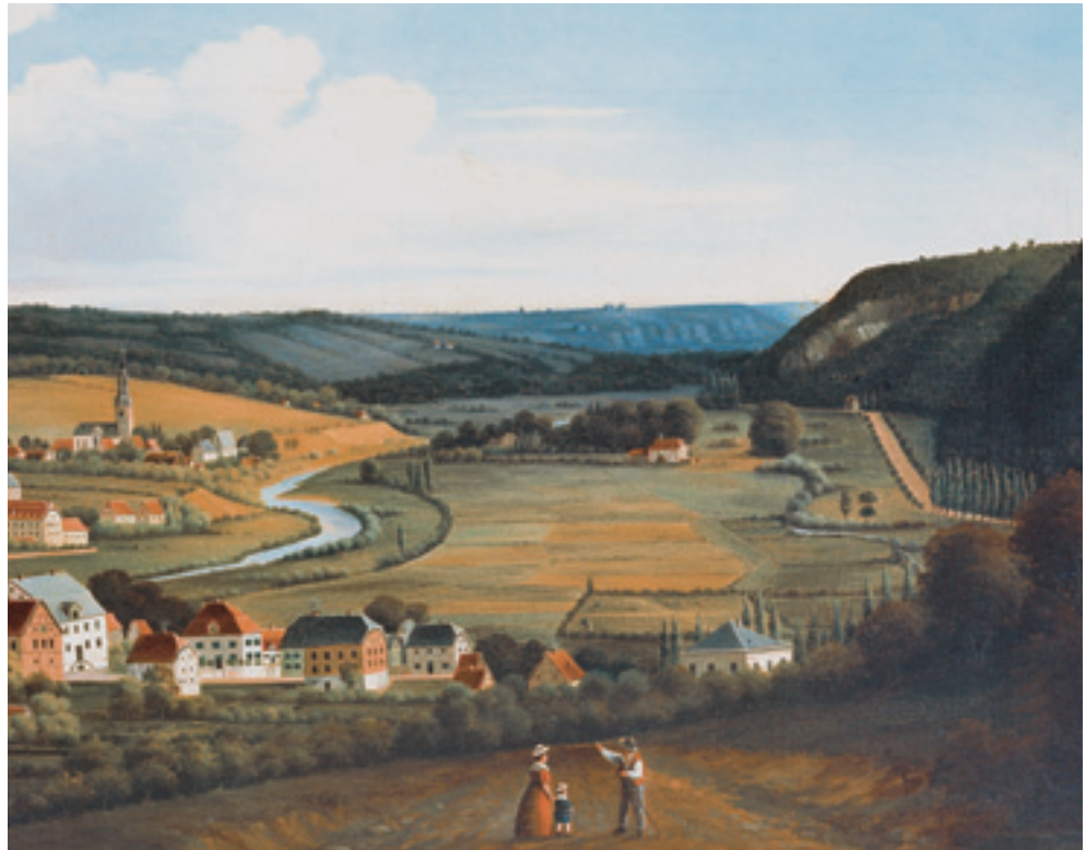
Die Drahtrollen im Nahmertal um 1800 mit der „Borggräfen-Rolle“ und der Rolle „Auf'm Graben“, die C.D. Wälzholz 1829 kaufte (Zeichnung von Herbert Boecker-Windfeder von 1883)