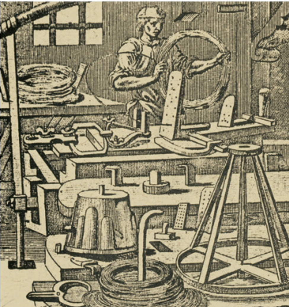
Drahtfertigung im 18. Jahrhundert: „Die Draht-Mühl. Des Werkens grobe Art, wird durch viel Trübsal zart. (...) Die Zange macht den Draht gelinder.“ (1698)