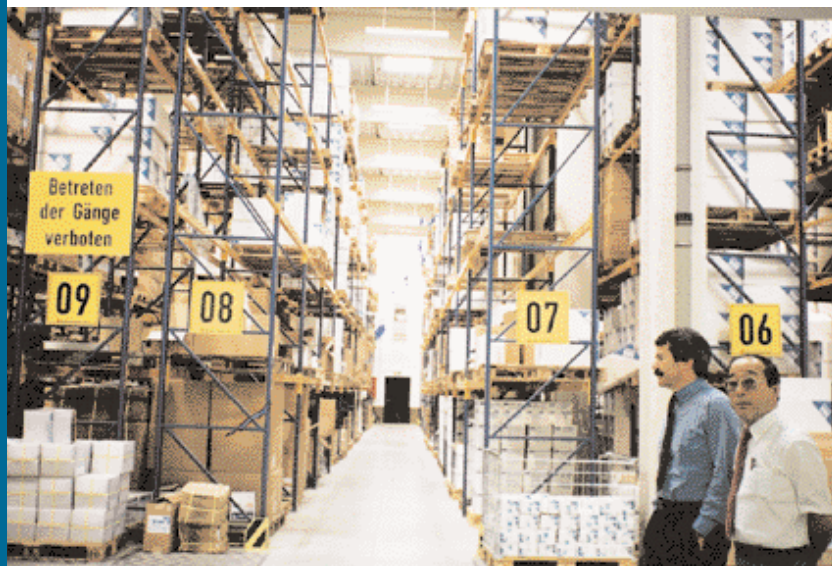
Das Hochregallager der Firma Dahlhausen (oben) und das Dahlhausen Messteam (oben rechts)