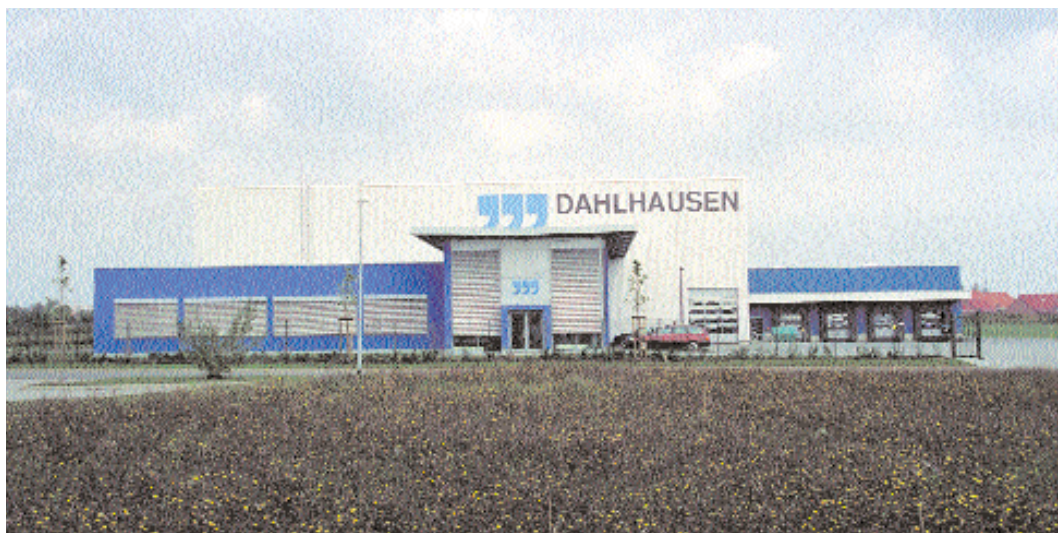
2003 eröffnete Dahlhausen in Halberstadt ein neues Logistikzentrum mit einem großen Hochregallager und einem Reinraum für kundenspezifische Produktzusammenstellung.

(Sanitätshäuser, Apothekengroßhändler) oder den Export. Weitere Mitarbeiter sind damit betraut, innovative und technisch hochentwickelte Spezialprodukte, Technologien und Therapiemethoden zu finden und in den Markt einzuführen.